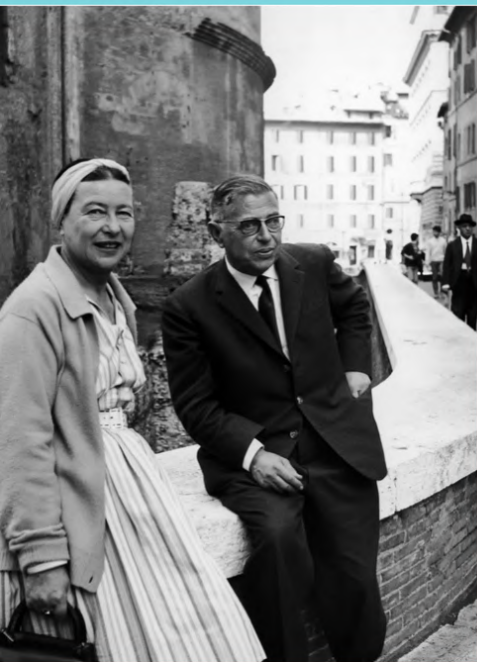
Simone de Beauvoir et Jean-Paul Sartre à Rome, 1963